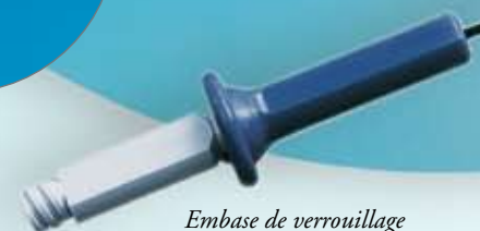
Embase de verrouillage pratique pour une intervention efficace