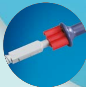
Livrée avec bague d'espacement rouge conçue pour maintenir l'aiguille à l'intérieur du cathéter pendant le transport (à retirer avant utilisation)